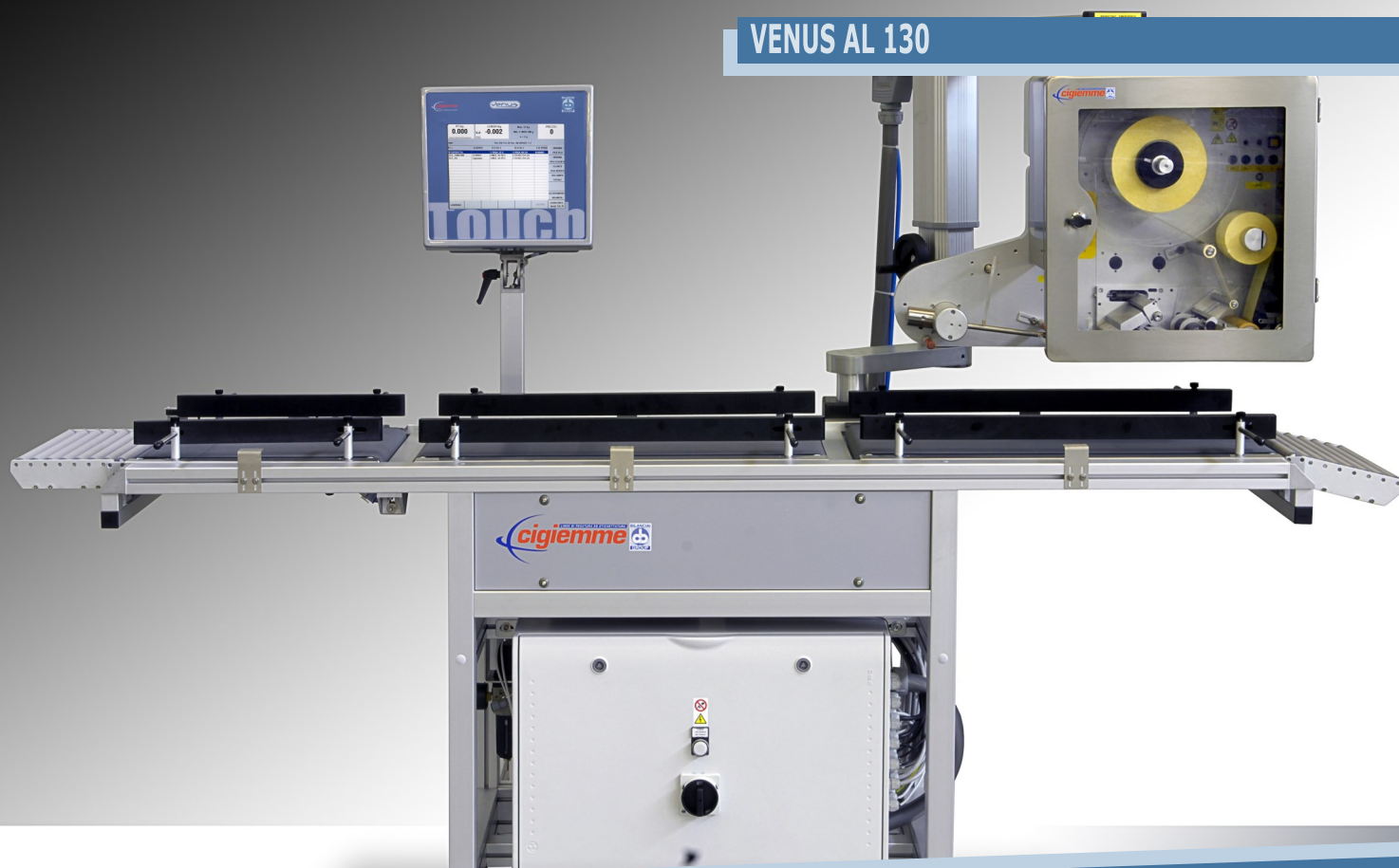
VENUS AL 130

ETIQUETADORA AUTOMÁTICA DE ETIQUETAGEM SUPERIOR CONTROLADORA DE PESO ESTÁTICA E DE ALTO RENDIMENTO PARA PRODUTOS DE PESO FIXO E VARIÁVEL ATÉ 70 ETIQUETAS/MIN ESTRUTURA EM ALUMÍNIO